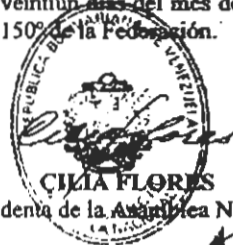
Presidenta de la Asamblea Nacional

Dado, firmado y sellado en el Palacio Federal Legislativo, sede de la Asamblea Nacional en Caracas, a los veintidós días del mes de julio de dos mil nueve. Año 199° de la Independencia y 150° de la Federación.